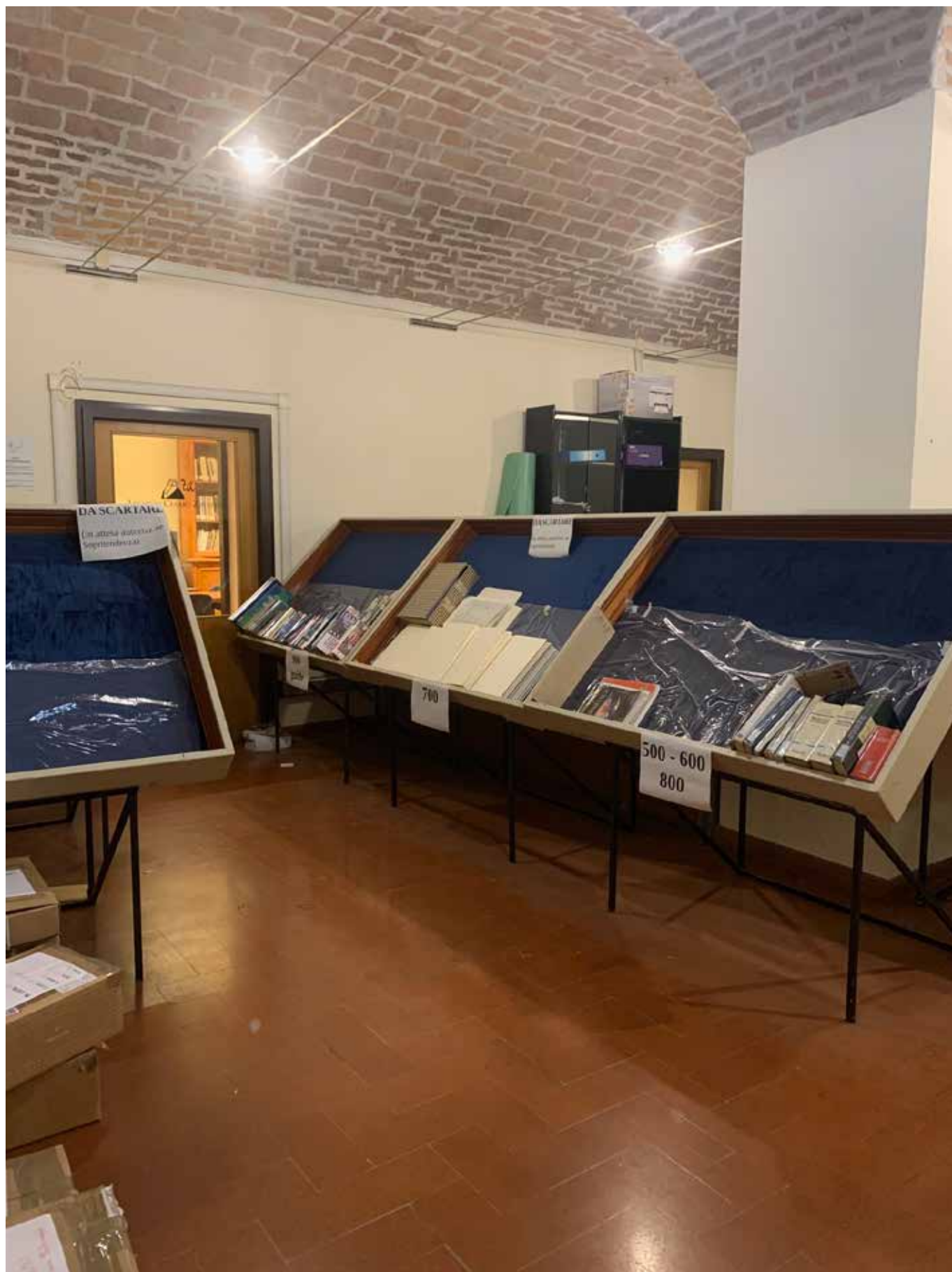
SALA IN CUI VERRA' COLLOCATO IL LABORATORIO DI DIGITALIZZAZIONE