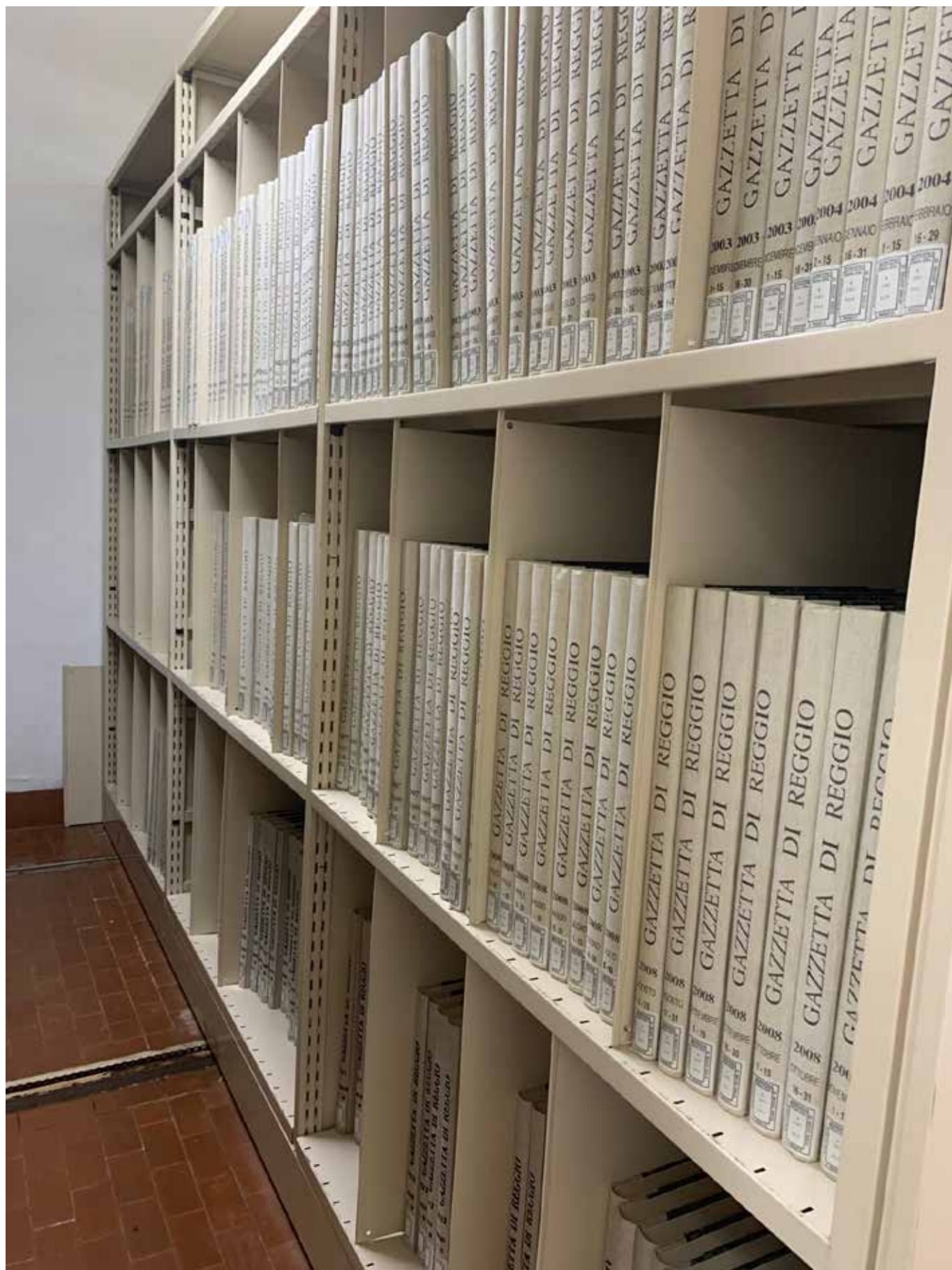
SCAFFALI IN CUI SONO COLLOCATI I PERIODICI