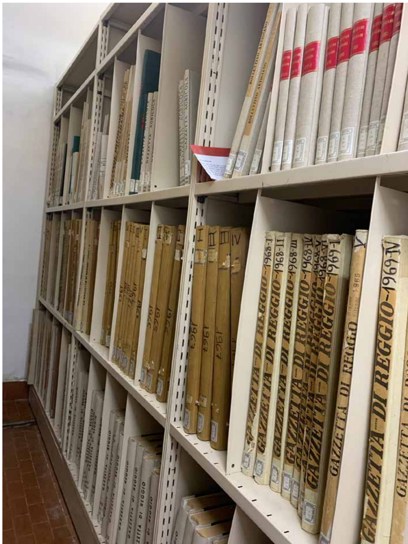
SCAFFALI IN CUI SONO COLLOCATI I PERIODICI