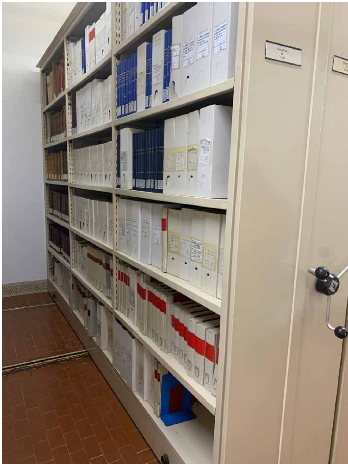
SCAFFALI IN CUI SONO COLLOCATI I PERIODICI