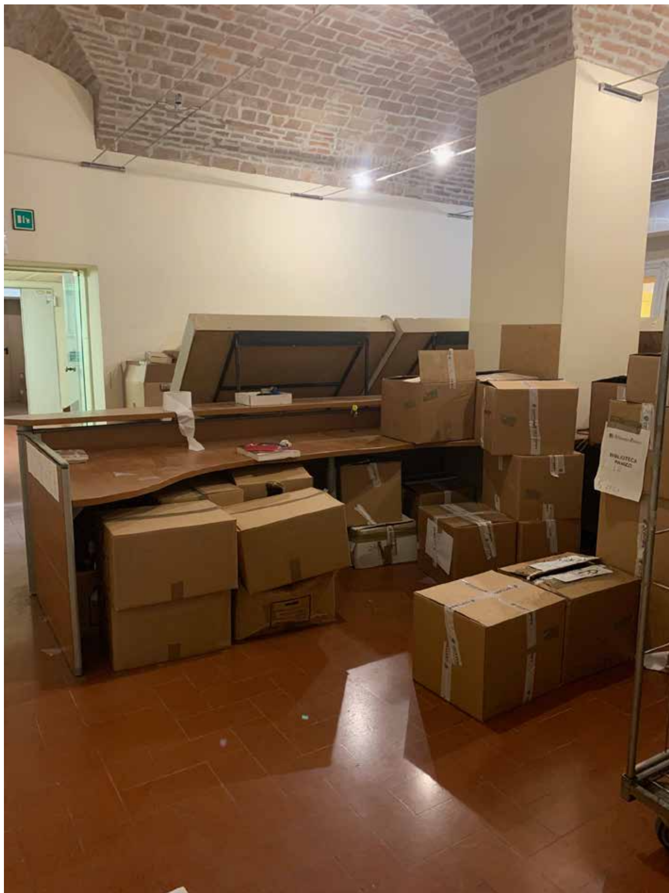
SALA IN CUI VERRA' COLLOCATO IL LABORATORIO DI DIGITALIZZAZIONE