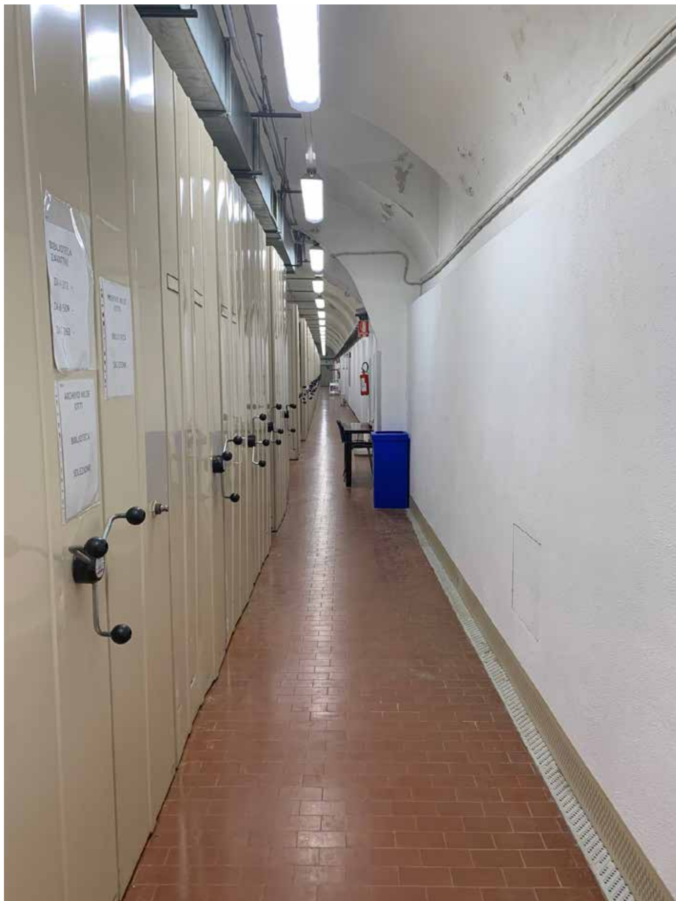
CORRIDOIO INTERRATO DEI DEPOSITI E ARCHIVI