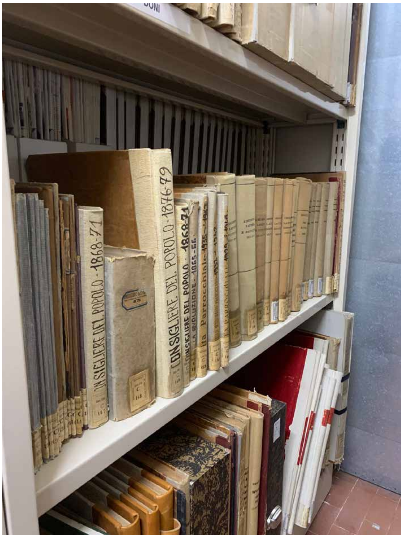
SCAFFALI IN CUI SONO COLLOCATI I PERIODICI